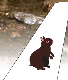
アマミノクロウサギ

JALグループは、奄美大島・徳之島・沖縄島北部および西表島世界自然遺産登録活動を応援しています。